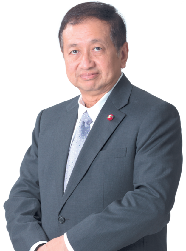
รังสรรค์ ศรีวรศาสตร์ ปลัดกระทรวงการคลัง

3. การผลักดันให้ประเทศไทยเป็นศูนย์กลางการค้าและการลงทุนของภูมิภาคอาเซียน ผ่านมาตรการภาษีและมาตรการการเงินเพื่อสนับสนุนการพัฒนาเขตเศรษฐกิจพิเศษ มาตรการภาษีเพื่อส่งเสริมการจัดตั้งสำนักงานใหญ่ข้ามประเทศ (IHQ) และมาตรการภาษีเพื่อส่งเสริมการจัดตั้งบริษัทการค้าระหว่างประเทศ (ITC) รวมทั้งในมิติการเชื่อมโยงเศรษฐกิจระหว่างภูมิภาค (Regional Connectivity) กระทรวงการคลังจะได้มีบทบาทสนับสนุนการพัฒนาโครงสร้างพื้นฐานด้านขนส่ง