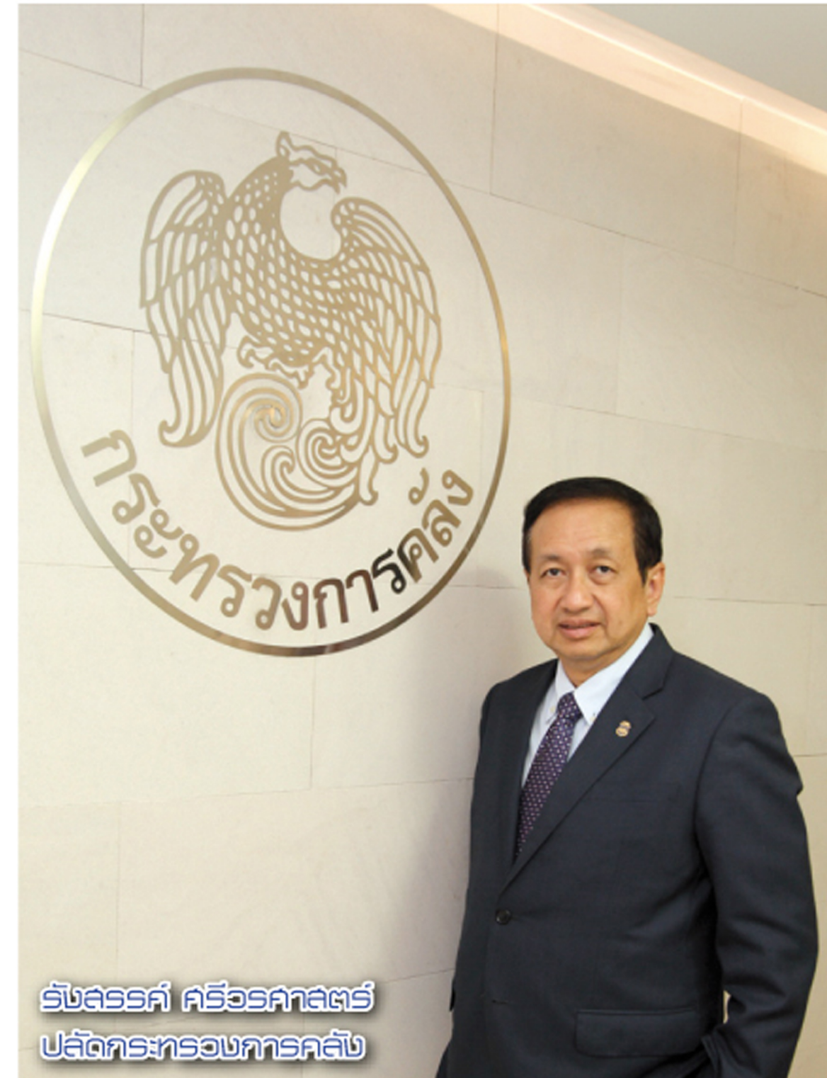
รัฐมนตรี ศิริรัตนา ศิริรัตนา ปลัดกระทรวงการคลัง

ปัจจุบันภูมิภาคเอเชียมีความต้องการการลงทุนด้านโครงสร้างพื้นฐานอย่างมีนัยสำคัญ และยังประสบปัญหาขาดแคลนเงินทุนในการพัฒนาโครงสร้างพื้นฐานอีกเป็นจำนวนมาก จากรายงานการศึกษา เรื่อง “Infrastructure for a Seamless Asia” โดยธนาคารพัฒนาเอเชีย (Asian Development Bank: ADB) ประมาณการว่า ในช่วง 10 ปี ระหว่างปี 2553-2563 (ค.ศ.2010-2020) ภูมิภาคเอเชียมีความต้องการการลงทุนด้านโครงสร้างพื้นฐานกว่า 750,000 ล้านดอลลาร์สหรัฐต่อปี คิดเป็นมูลค่ารวมกว่า 8 ล้านล้านเหรียญสหรัฐ รวมถึงความต้องการด้านโครงสร้างพื้นฐานของไทยอีกเป็นจำนวนมาก