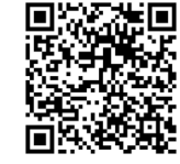
Infographic การลงทะเบียน และการใช้วอลเล็ต สบม.