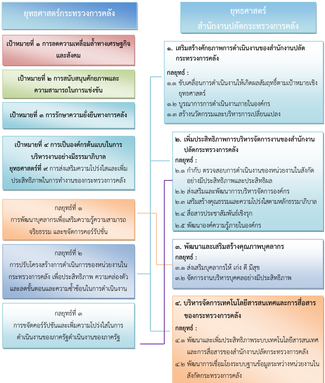
แผนภาพที่ ๓: ความสัมพันธ์ระหว่างยุทธศาสตร์กระทรวงการคลังกับยุทธศาสตร์สำนักงานปลัดกระทรวงการคลัง